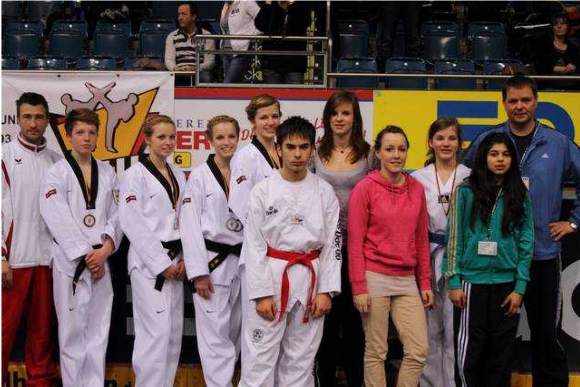
TVSH Team Technik und Wettkampf am zweiten Wettkampftag in der Saturn Arena zum Gruppenfoto angetreten